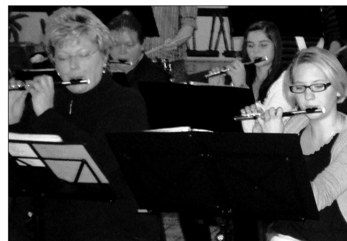
Die Proben des Spielmanns- und Fanfarenzugs Somborn laufen auf Hochtouren.