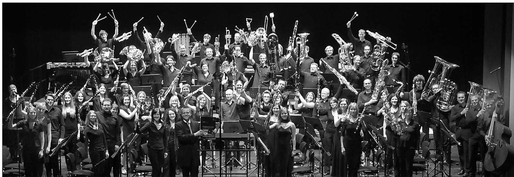
Die Musiker der Bläserphilharmonie Rhein-Main genießen den Applaus nach dem Konzert.